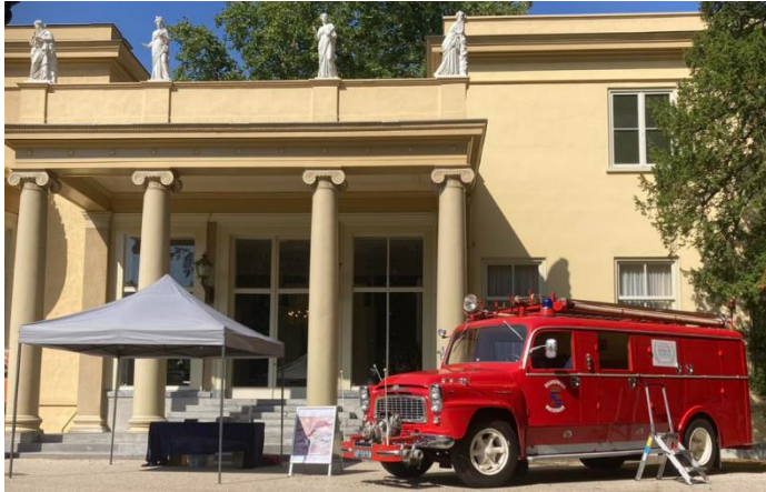
De GM tijdens de Open Monumentendag voor het raadhuis De Paauw.