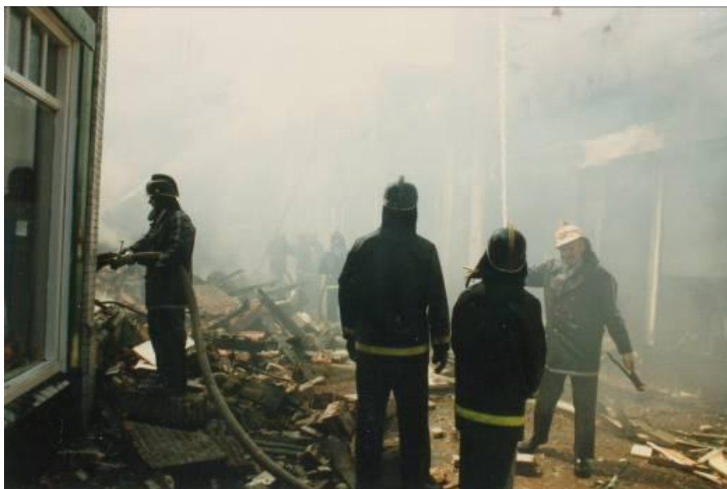
Na de explosie bij het nablussen in de Schoolstraat op 21 juni 1986