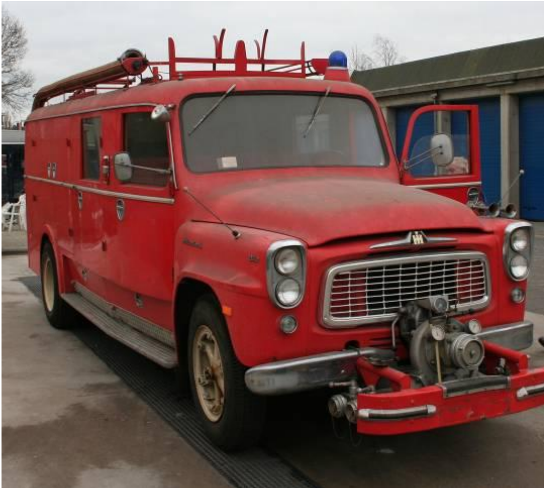
een van de twee historische voertuigen, de International uit 1964, waarvoor ruimte voor stalling en restauratie noodzakelijk is

De twee historische voertuigen die in 2010 in Wassenaar zijn teruggekomen zijn nu beide in een droge ruimte gestald. De stalling van deze voertuigen, die ook tot de gemeentelijke collectie behoren is daarmee echter nog maar voorlopig geregeld. Om de voertuigen te restaureren is ruimte nodig waarin de vrijwilligers er aan kunnen werken.