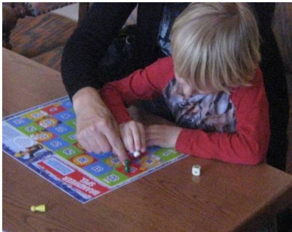
een jeugdige bezoeker tijdens het museumweekend