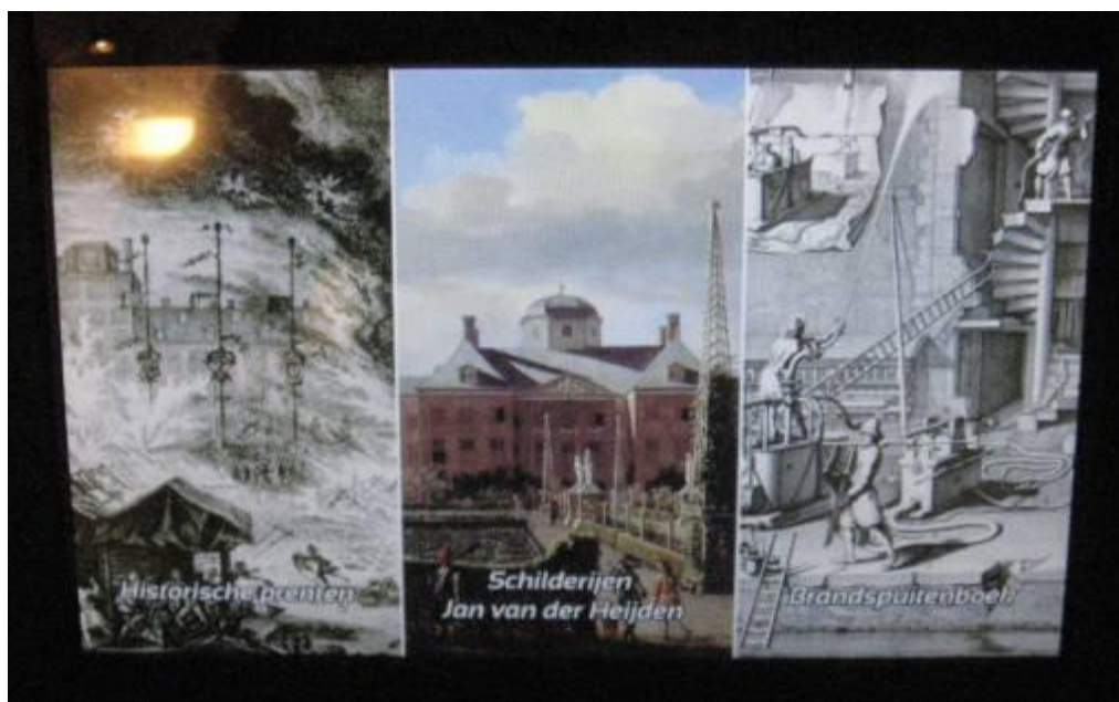
een foto van een van de aanraakschermen

De totale kosten hiervan waren € 12000. De Gemeente Wassenaar, het Fonds 1818, het Rabobank Stimuleringsfonds, het Van Ommeren de Voogt fonds en het ANWB fonds hebben dit project financieel mogelijk gemaakt.