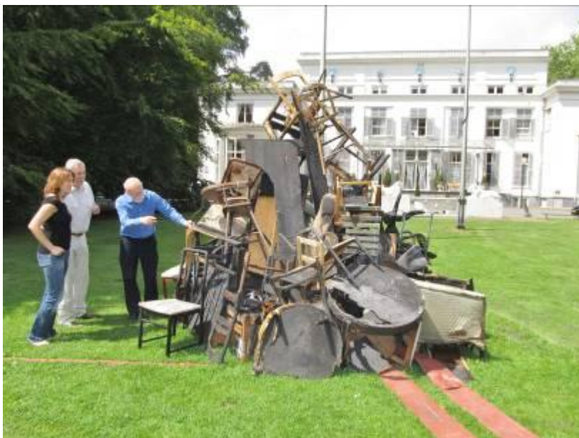
uitleg bij het kunstwerk, gemaakt door leden van de Kunstgroep Wassenaar

De jaarlijkse tentoonstelling van de Kunstgroep Wassenaar in De Paauw was op ons verzoek gewijd aan het thema “water en vuur”. Bovendien maakten enkele leden van de kunstgroep met oude brandweerslangen en ander materiaal een kunstwerk dat voor de Paauw op het gazon heeft gestaan.