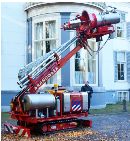
blusrobot tijdens de innovatiedag