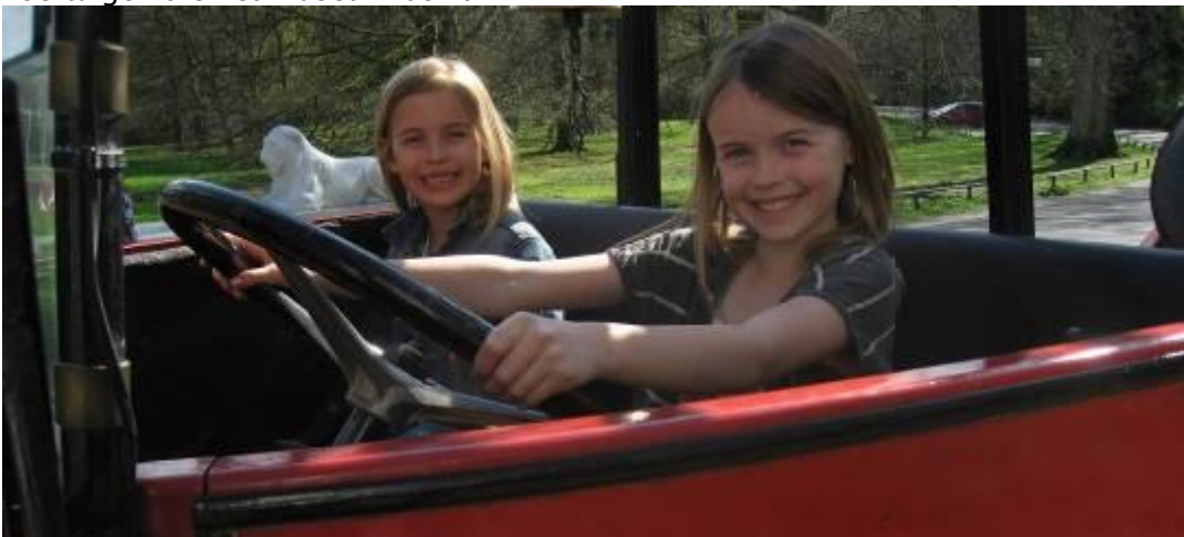
De Magirus uit 1931, in beheer bij de Stichting Historisch Brandweermaterieel in Den Haag, mogen we regelmatig lenen. Tot vreugde van de jeugdige bezoekers.

Kortom, het gaat goed, maar er zijn ook zorgen. Vooral achter de schermen is er nog veel te doen, in het bijzonder met betrekking tot de collectie: registratie, documentatie, onderhoud en restauratie, opbergen. We hebben te weinig ruimte om de collectie die niet in de vaste opstelling kan verantwoord op te slaan, zoals de textielcollectie (uniformen e.d.). Dat geldt ook voor materiaal zoals dat van de reizende tentoonstelling en ander tentoonstellingsmateriaal. Oproepen voor opslagruimte leverden geen resultaat op. Ook in 2014 is het helaas niet gelukt om geschikte ruimte te vinden voor de stalling en restauratie van de twee historische voertuigen die het museum bezit.