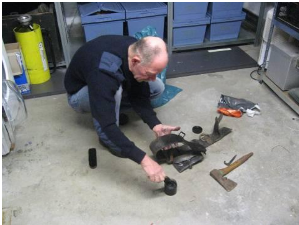
een vrijwilliger aan het werk