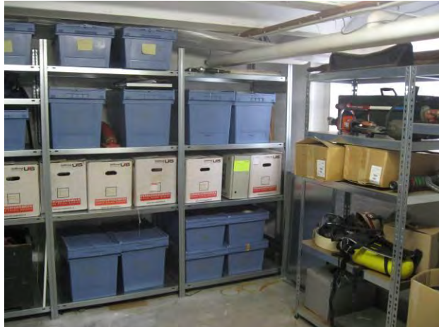
een kijkje in de depotruimte van het museum

Daarvoor is specifieke deskundigheid nodig. In 2013 zijn we begonnen met scholing van vrijwilligers op dit gebied. Dat wordt in 2014 voortgezet, mede dankzij een actie van Fonds 1818 die gratis cursussen van het Erfgoedhuis aanbiedt.