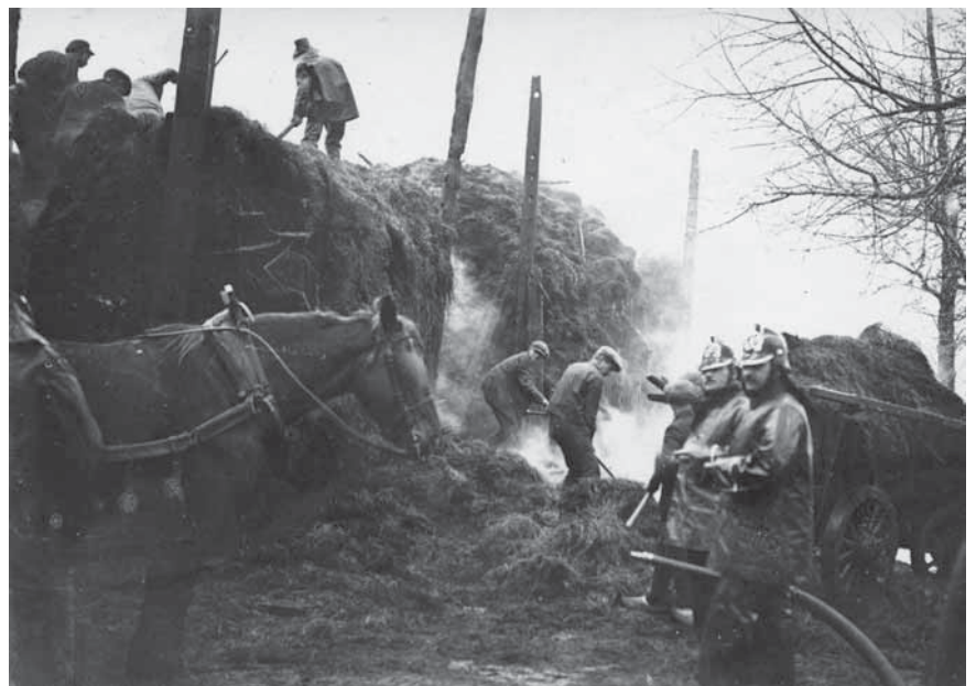
Van der Mark hield zich erg bezig met hooibranden.

Zeer werd door hem ook het huidige alarmsysteem geprezen en de aanwezigheid van 6 of 7 slangenwagens op verschillende punten in het dorp, waarmede