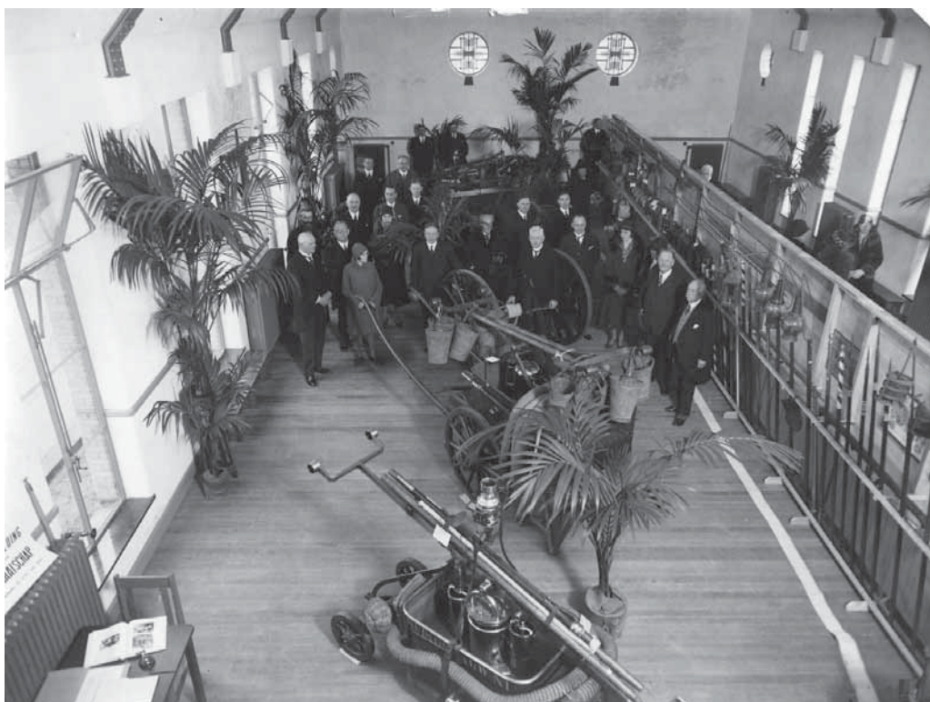
De expositie op de Pius-school in 1931.